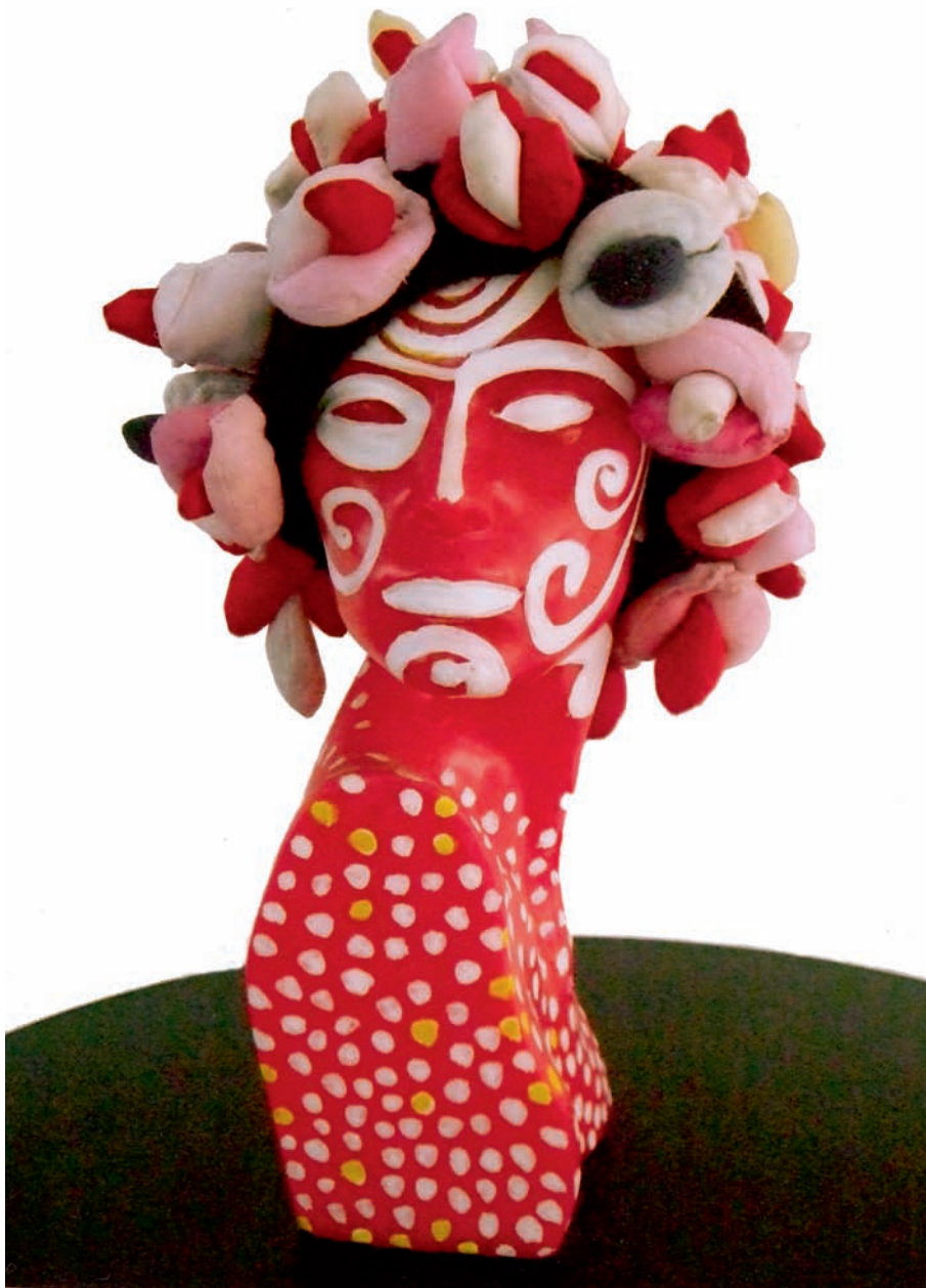
„Monument”, obiekt z serii „Alexandra Fly”, technika mieszana, 45x10x15 cm, Berlin, 2010