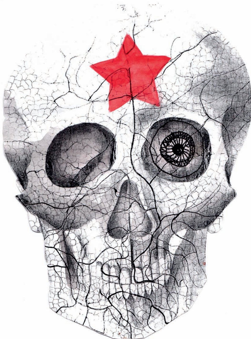
„Chińska Czaszka”, rysunek, ołówek, kolorowy pisak, warsztaty ze studentami College, Harbin, Chiny, 2011