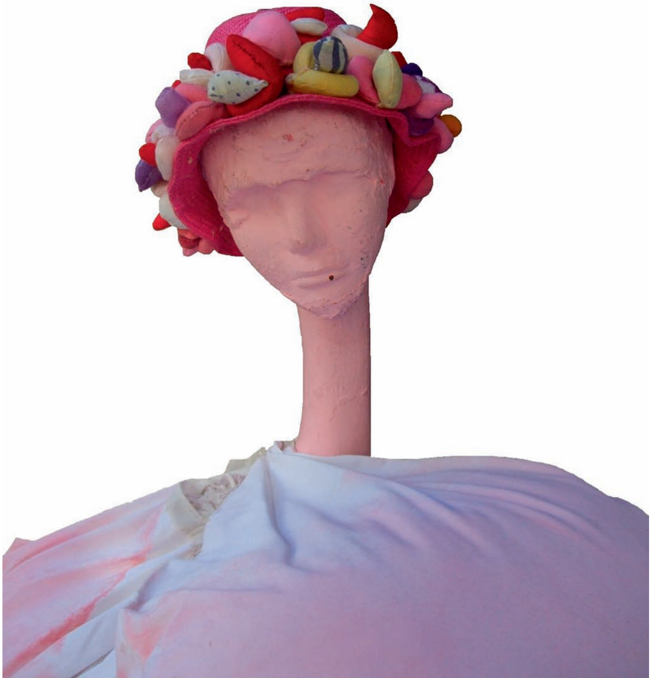
„Kapelusz Fly”, obiekt, Berlin, 2013