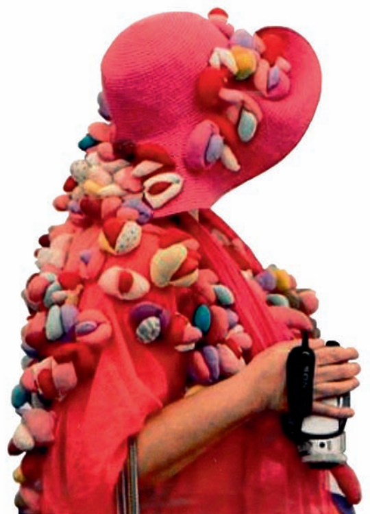
Projekt „Alexandra Fly”, Luxury, The Telegraph, Frieze Art Fair, Londyn, 2013