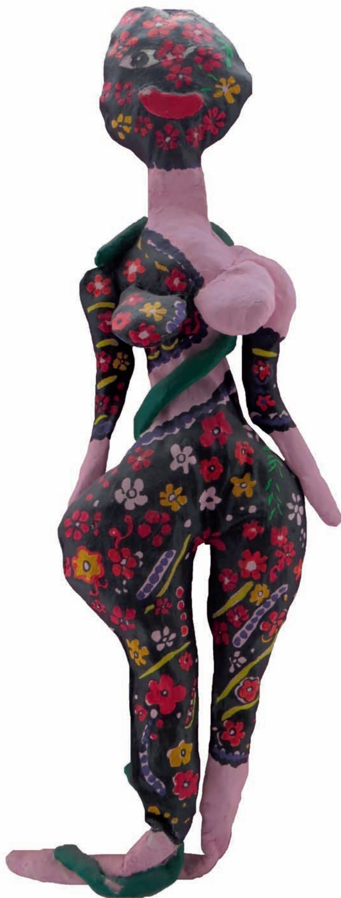
„Tattoo doll”, rzeźba, płótno, akryl, 40x15x2 cm, Berlin, 2003