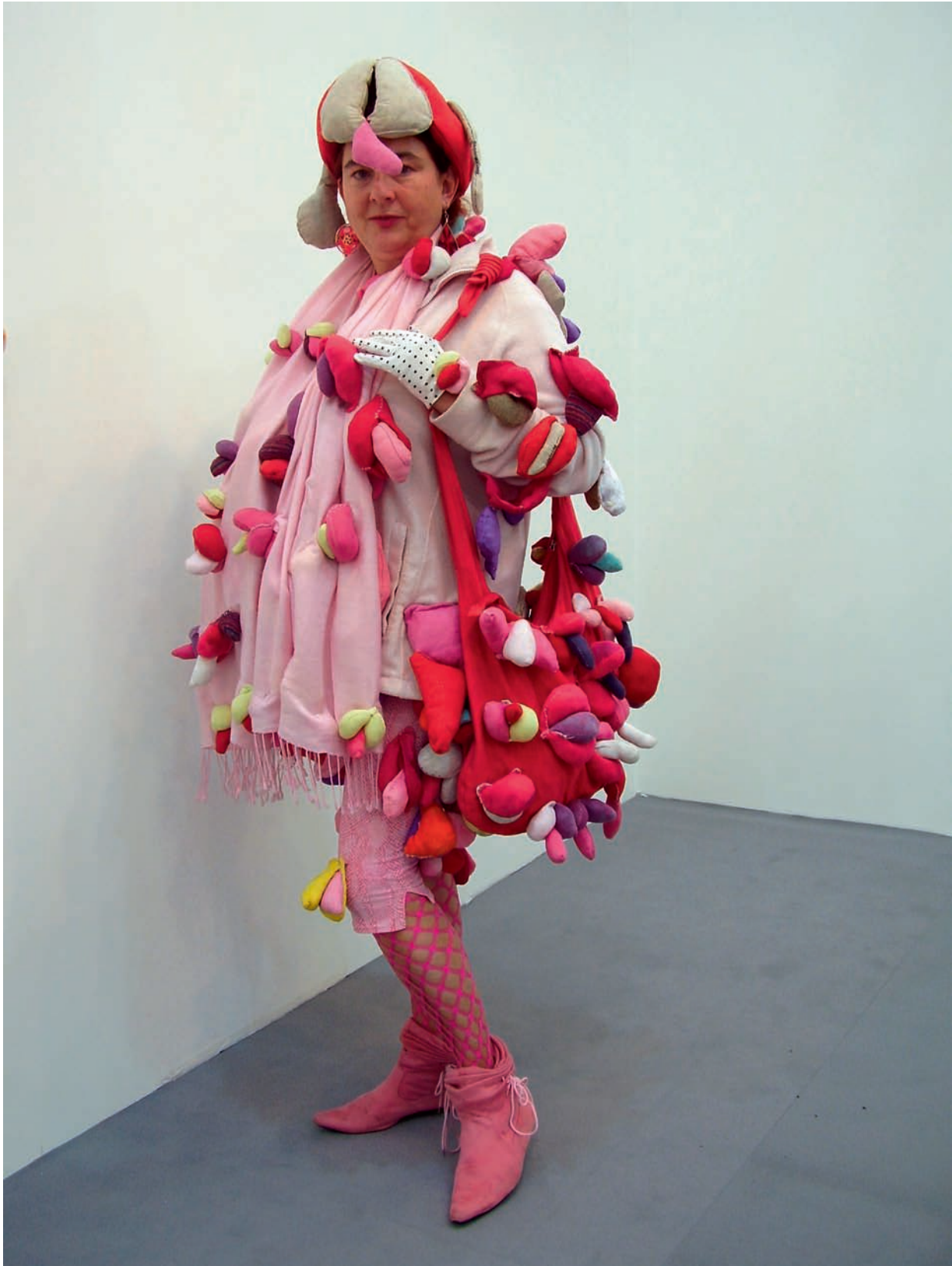
Projekt „Alexandra Fly”, Firieze Art Fair , Londyn, 2009