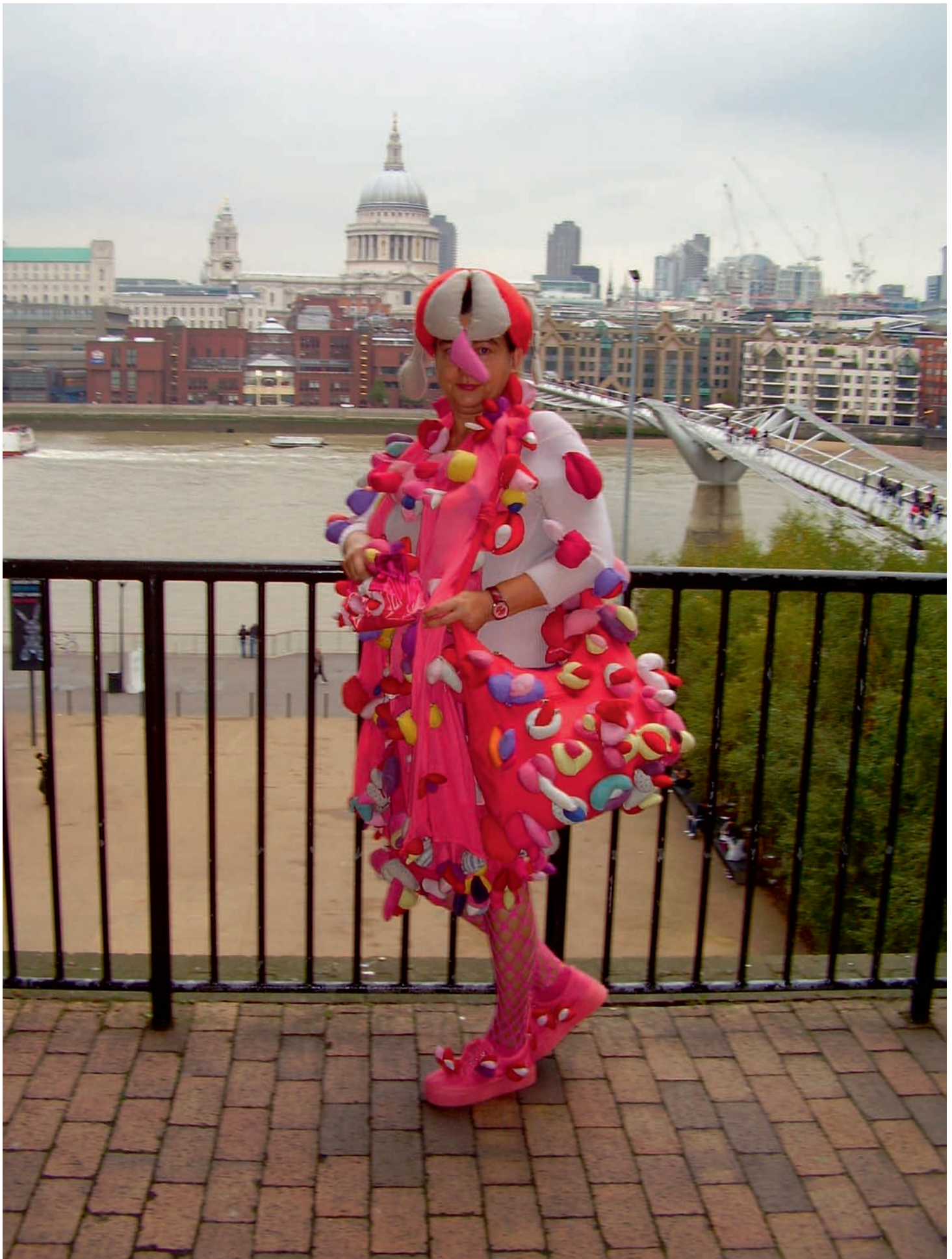
„Alexandra Fly” w Tate Modern w Londynie, 2009