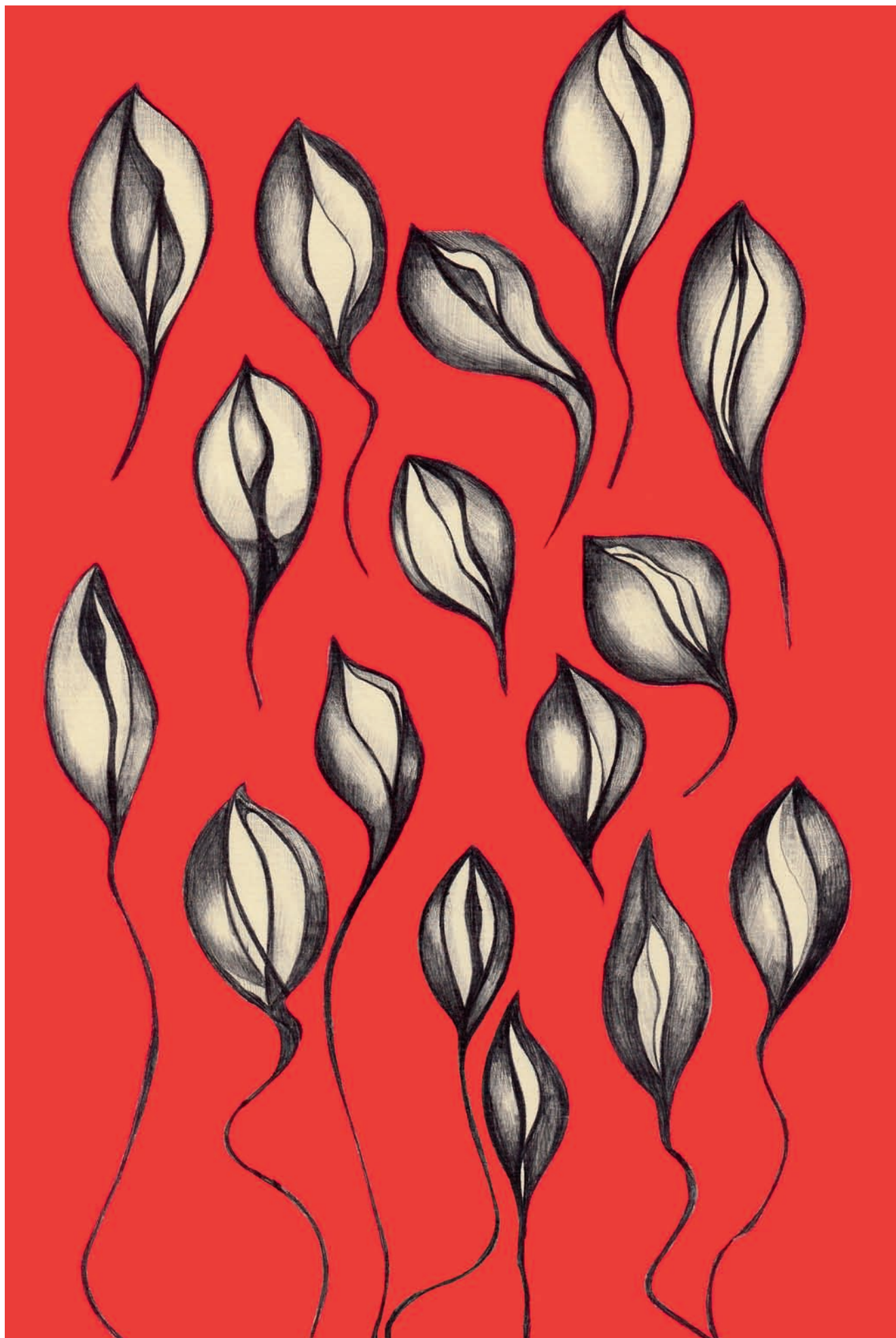
„Czarne waginy na czerwonym”, rysunek na papierze, długopis oraz technika digitalna, 29,5x20 cm, Berlin, 2014