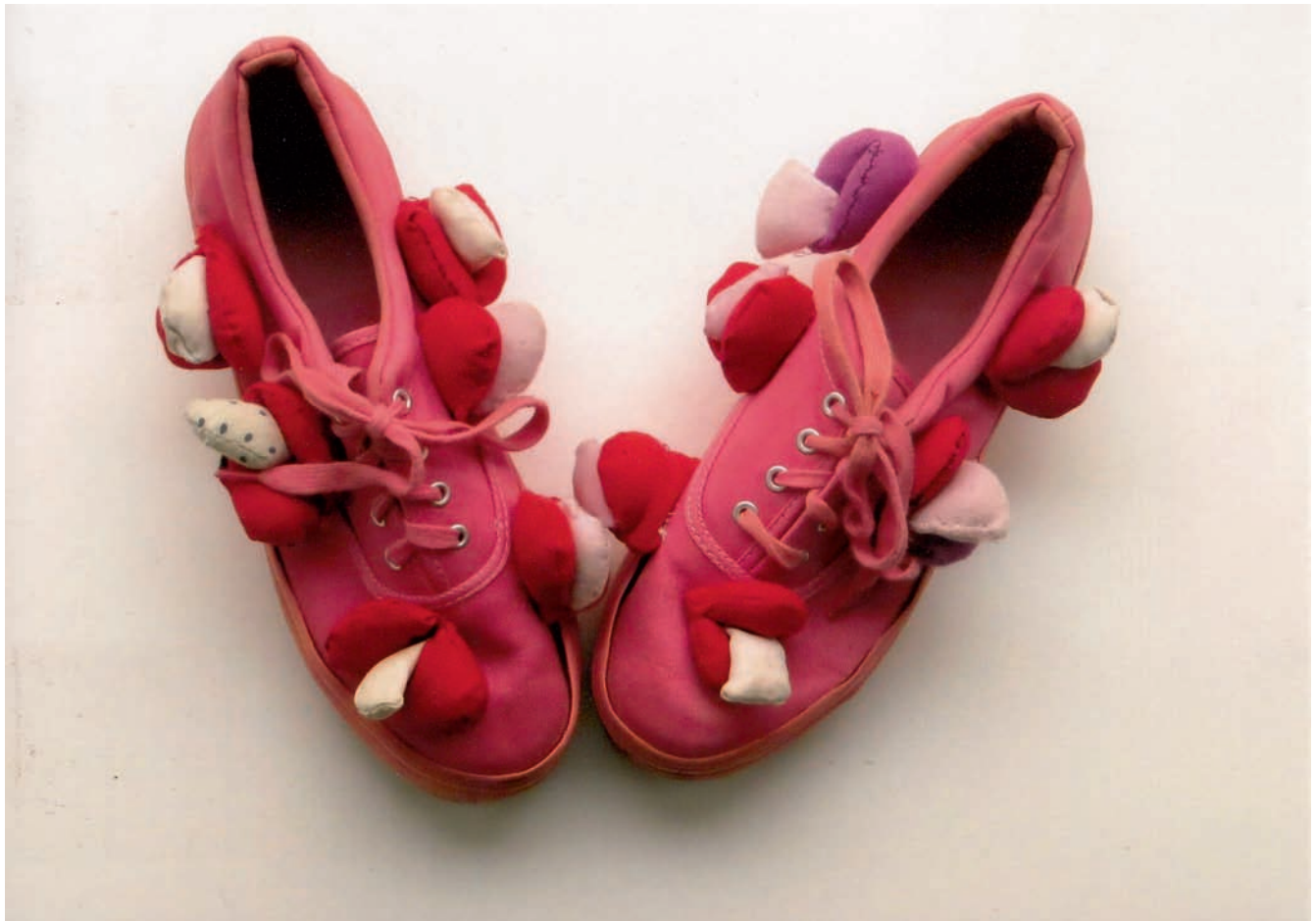
„Buty Fly”, Projekt „Alexandra Fly”, objekt, Berlin, 2010 „Buty Fly 2”, Projekt „Alexandra Fly”, objekt, Berlin, 2012