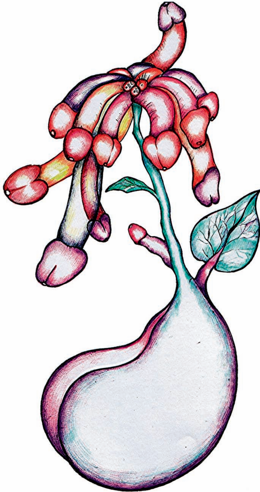
„Sexy Nymph”, rysunek, ołówek, kolorowy pisak, Berlin, 2003