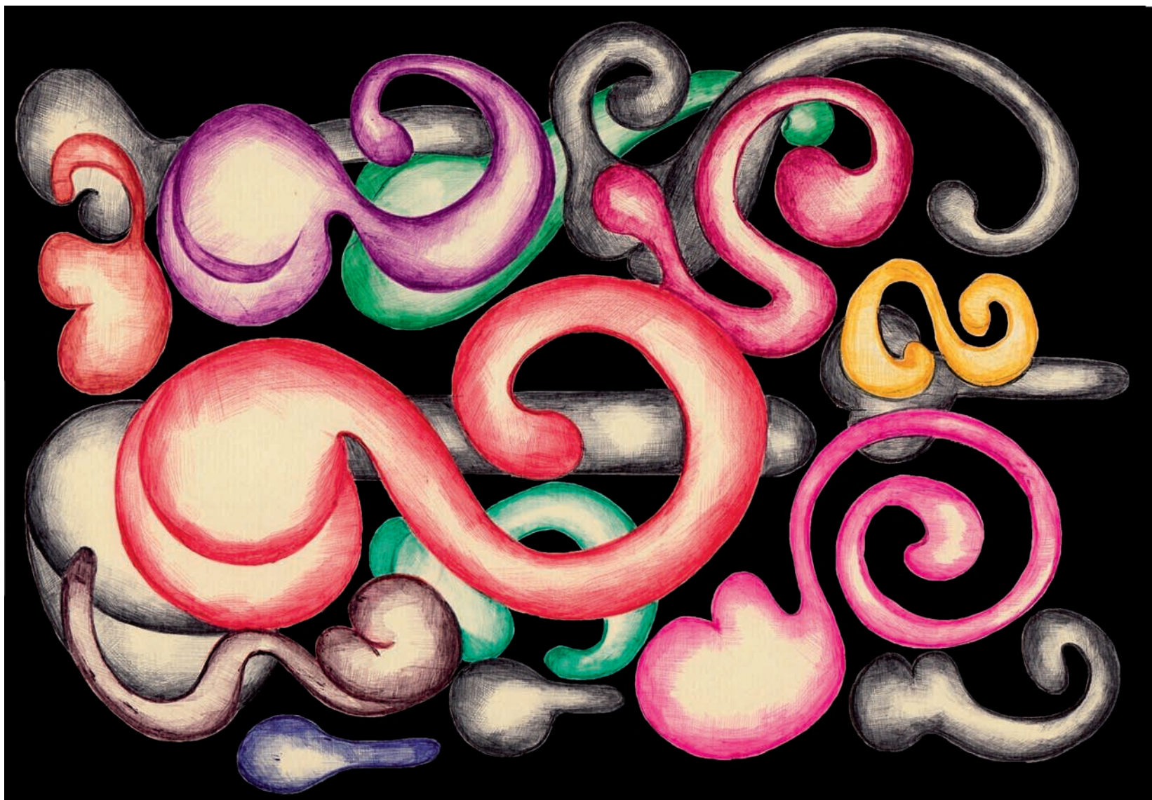
„PPP”, rysunek na papierze, długopis oraz technika digitalna, 29,5x20 cm, Berlin, 2014